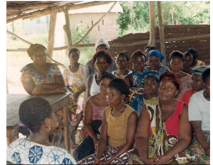
Hiv/aids voorlichting aan marktvrouwen

Door deze specifieke doelgroepen bij de voorlichting te betrekken, bereiken we een groot deel van de bevolking. Sinds het begin van dit jaar heeft Association Lanminsin op deze manier 36 voorlichtingsbijeenkomsten georganiseerd, waarbij we ruim 700 mannen en 1700 vrouwen hebben bereikt. Tijdens de bijeenkomsten legt een huisarts de verschillende aspecten van hiv-besmetting en preventie uit. Ook wordt getoond hoe het mannencondoom correct gebruikt moet worden.