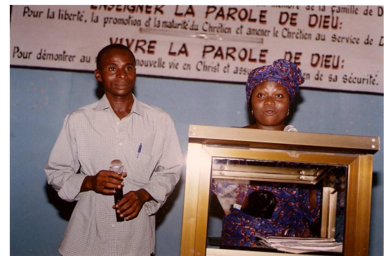
Flora spreekt voor een christelijke groep over hiv/aids